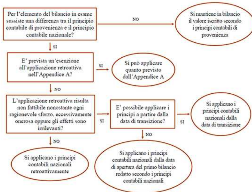
Fig. 2.1 – Iter logico per la costruzione dello stato patrimoniale d'apertura